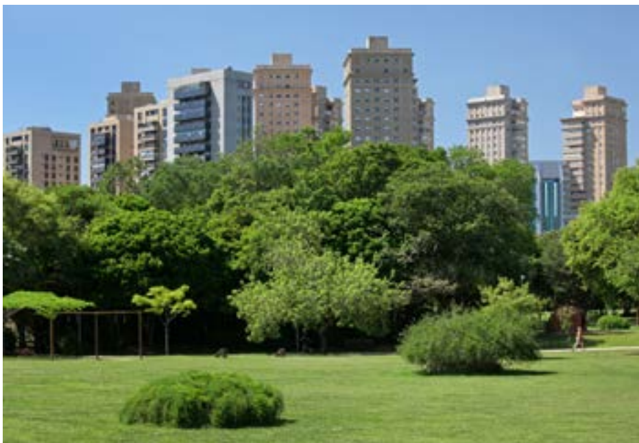
Parque Villa-Lobos.